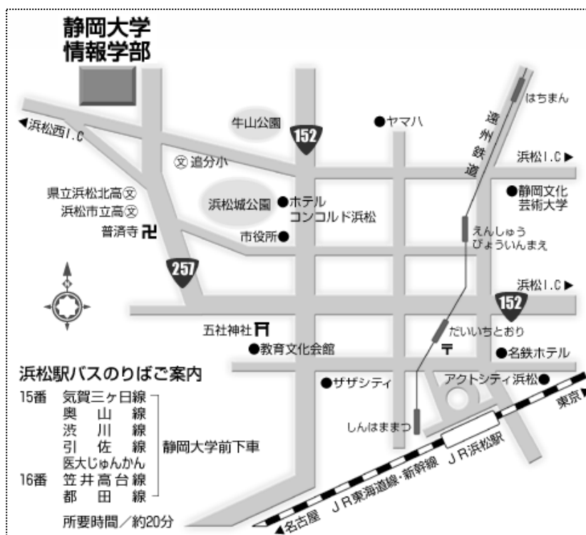
静岡大学浜松キャンパスまでのアクセス